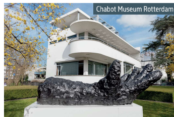
Chabot Museum Rotterdam