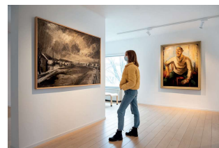
Het Rotte Land